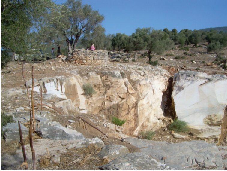
G. 6: Mandalya kırsalında olası bir kiliseye ait apsis ve duvar kalıntıları

Yüzeysel araştırması alanında saptanan dibek, ağırlık taşı veya gerek yerinde kaya oyma gerekse non situ olarak bulunan zeytin veya üzüm ezme tekneleri gibi arkeolojik veriler tarımsal üretimin hem kıyı hem iç kesimlerde kırsal hayatın önemli bir parçası olduğunu göstermektedir. 31 Nitekim zeytinlikler bugün de bu bölgenin ana geçim kaynaklarından birini oluşturmaktadır. Seramik üretimi ve yerel mermer ve taş (kalker) ocaklarının işletilmesi de önemli bölgesel gelir kaynakları arasında bulunmaktaydı. 32 Bölgede tespit edilen seramik buluntular ağırlıklı olarak 5. ve 7. yüzyıllar arasında kümelenirken 33 yerel İasos mermerinin işletim ve ticaretinin de Roma İmparatorluk Dönemi'nde ve özellikle 6. yüzyılda yoğunlaştığı gözlemlenmektedir.