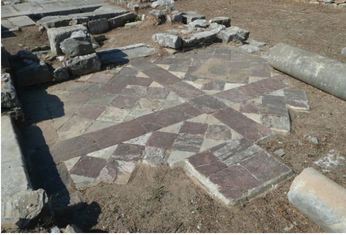
G. 10: Iasos, Agora Bazilikası, Iasos mermerinden opus sectile yer döşemesi (Ufuk Serin, 2012)