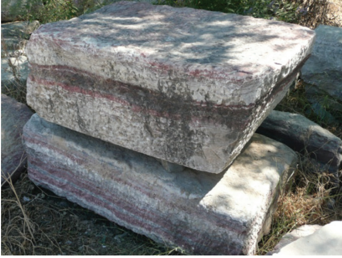
G. 7: Iasos, 'Balık Pazarı' çevresinde yarı işlenmiş Iasos mermeri blokları (Ufuk Serin, 2009)