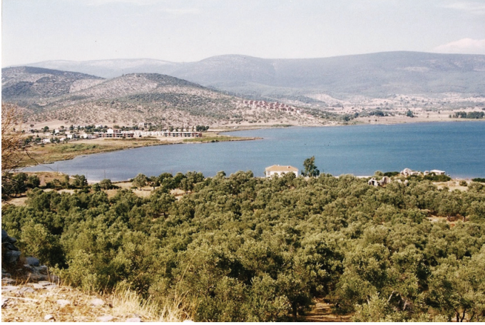
G. 8: Iasos, Doğu Limanı: Orta/Geç Bizans kilisesinin kalıntıları kıyıda sağda görülmektedir (Ufuk Serin, 2004)

Iasos mermerinin Konstantinopolis/İstanbul'da St. Polyeuktos (Aziz Polieuktos) ve St. Sophia (Ayasofya), Ephesus'ta St. John (St. Jean) ve Ravenna'da San Vitale gibi 6. yüzyılın önemli kiliselerinde kullanılmış olması bu mermerin gerek bölgesel gerek denizaşırı ihracatının bu dönemde en üst düzeye ulaşmış olduğunu göstermektedir. 40