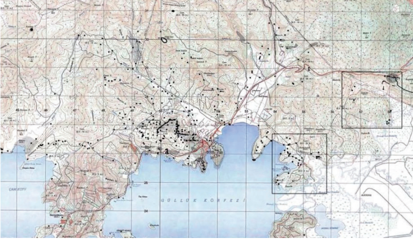
G. 3: Mandalya Körfezi Arkeolojik YüzeY Araştırması Alanı (AYDIN N19-a3-4)