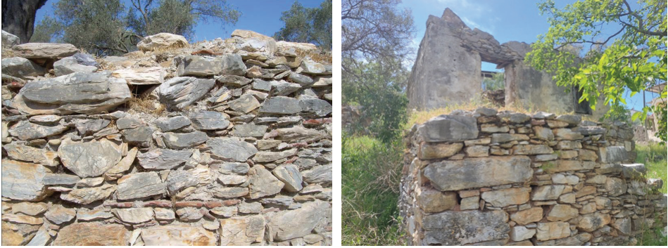
G. 4 ve G. 5: Bölgede Roma, Geç Roma ve Bizans Dönemleri boyunca rastlanan moloz taş ve tuğla parçacıkları içeren duvar tekniği; Kıyıkışlacık köyünde benzer yapımla yapılmış köy evlerinden bir örnek

çekirdek yerleşim modelleriyle benzerlik gösterdiği gibi, 24 taş bir duvarla çevrili ve bir avlu etrafında birkaç odadan oluşan köy evleri de 4. ve 7. yüzyıllar arasında yine çok sık görülen tipik kırsal konut birimine örnek oluşturmaktadır. 25 Angeliki Laiou'nun da belirttiği gibi hem konut hem üretim birimlerinden oluşan bu yerleşim biçimi, Bizans İmparatorluğu'nda nüfus, güvenlik kaygıları ve değişen ekonomik ve politik güç dengelerine bağlı olarak değişiklik gösterebilmektedir. 26