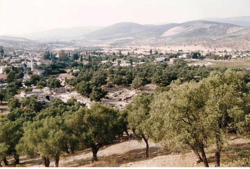
G. 2: Iasos, akropolden kuzeybatı yönünde iç kesimlere genel bakış: Ortada agora, arkada bugünkü Kıyıkışlacık köyü görülmektedir (Ufuk Serin, 2004)

Kronolojik olarak bu çalışmanın odak noktasını oluşturan Geç Antik ve Bizans Dönemleri üzerine yazılı kaynaklar oldukça sınırlı olmakla birlikte, 8 arkeolojik veriler 5. ve 6. yüzyıllarda Karia kentlerinde önemli bir yapı faaliyetine işaret etmektedir. Bu dönemde Iasos ve Bargylia gibi küçük ölçekli kentlerde bile çok sayıda kilise inşa edilmiş, 9 başta kıyı bölgeleri olmak üzere yeni yerleşimler kurulmuş ve bunların bir kısmı piskoposluk merkezi hâline gelmiştir. 10