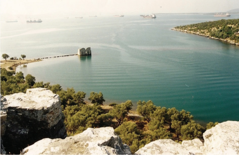
G. 1: İasos, akropolden Mandalya (Güllük) Körfezi’nin görünüşü (Ufuk Serin, 2004)

lerin tarihî gelişimi ve kendilerini besleyen kırsal çevreyle birlikte çağlar boyunca hayatta kalabilmeleri denizle yakından ilişkili olduğundan Mandalya Körfezi, Antik Dönem’de ismini buradaki kıyı kentlerinden alarak “İasos Körfezi” veya “Bargylia Körfezi” olarak adlandırılmaktaydı (G. 1). 5 Yüzeysel araştırması alanı dışında kalmakla birlikte, Antik Çağ’da Karia’ya tarihî ve politik önem kazandıran Miletus (Milet) ve Mylasa (Milas) da bu bölgede bulunmaktadır. 6 Bu geniş çerçevede, Mandalya Projesi’nin merkezini oluşturan ve uzun yıllar kazı ve yüzeysel araştırması çalışmalarının birlikte yürütüldüğü İasos kırsalı ( territorium ) bu makaleye temel teşkil etmektedir (G. 2). 7