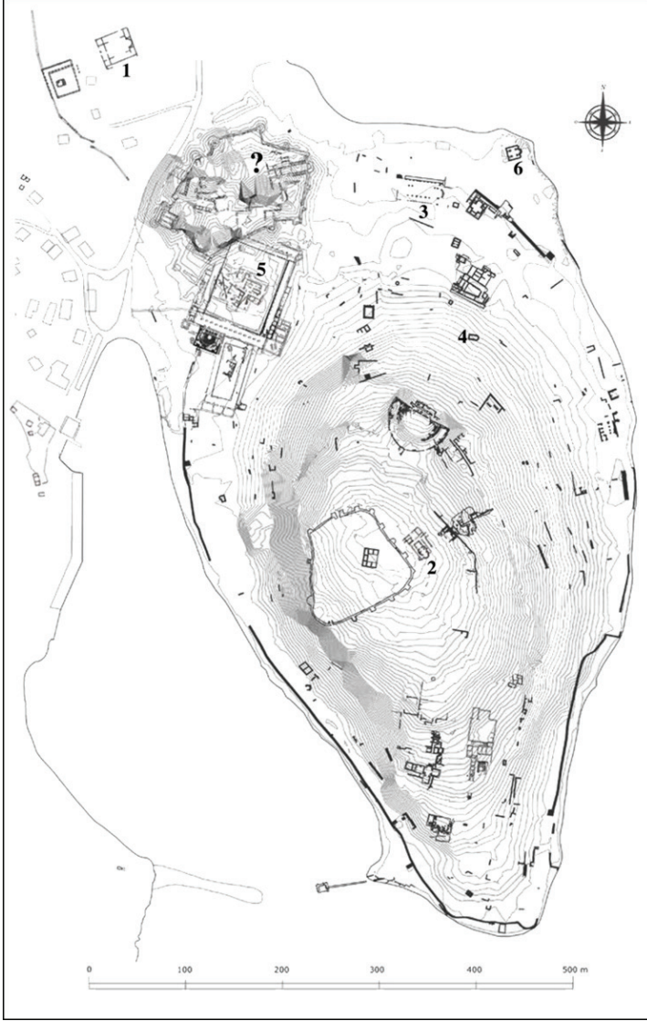
G. 11: Iasos, kent planı: 1. Roma Dönemi anıt mezar yapısı ('Balık Pazarı') ve Geç Antik bazilika; 2. Akropol Bazilikası; 3-4. Henüz kazılmamış kiliseler; 5. Agora Bazilikası; 6. Doğu Kapısı dışındaki Orta/Geç Bizans kilisesi; (?) Kısıttaki sur içi alanda bir kiliseye ait olabilecek kalıntılar (Marcello Spanu, "The 2012 and 2013 Excavation and Research Campaigns at Iasos," fig. 12 üzerinden yazar tarafından geliştirilmiştir).

vam ettiğini göstermektedir. Buradaki mezar buluntuları 6. yüzyılın sonlarından 16. yüzyıla uzanan geniş bir kronolojik çerçeveye yayılmakla birlikte, veriler özellikle 6.-7. yüzyıllarda ve 11. yüzyıl sonrasında yoğunlaşmaktadır. 49