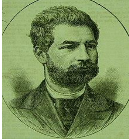
Resim-1: Küçük Ermenistan İhtilal Komitesi'nin ilk başkanı Tomayan Karabet (1893-?)