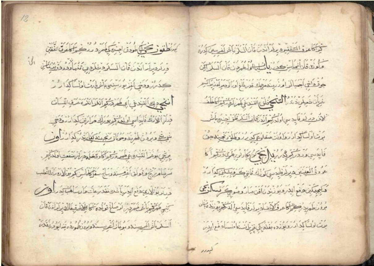
Şekil 4. Firâset-nâme'nin 11b-12a varâğı