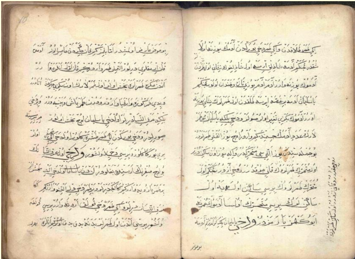
Şekil 2. Firâset-nâme'nin 9b-10a varacağı