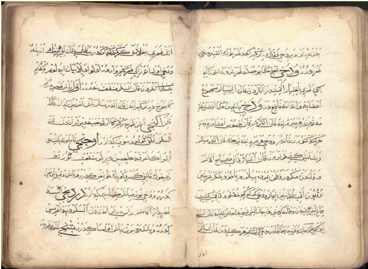
Şekil 3. Firâset-nâme'nin 10b-11a varacağı