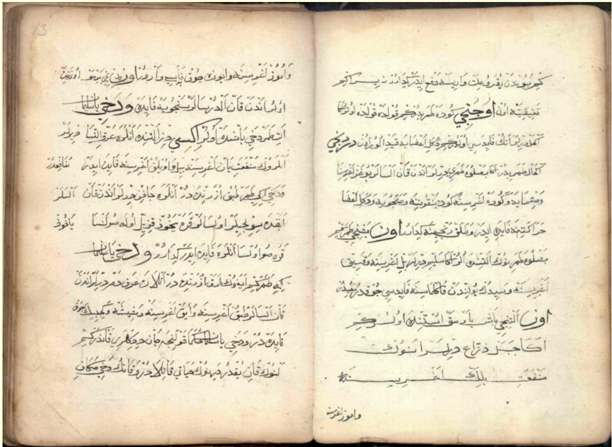
Şekil 5. Firâset-nâme'nin 12b-13a varâğı