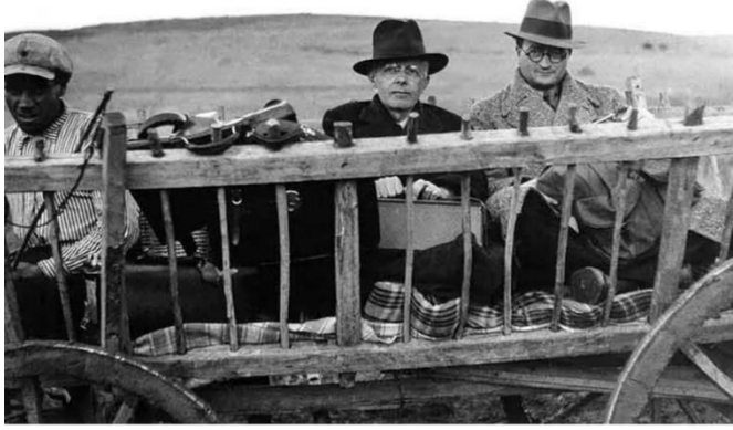
Görsel 5. Béla Bartók ve besteci Ahmet Adnan Saygun Anadolu'da (URL-3)

Bütün bu aşamalar göz önüne alındığında Bela Bartok'un Türkiye seyahati kısa bir gezi gibi görünmesine rağmen Türk müzik tarihine önemli etkilerde bulunmuştur. Ahmet Adnan Saygun, Necil Kazım Akses ve Ulvi Cemal Erkin bu gezi ile etkileşim kurmuşlardır. Böylece bu etkileşim bestecilerin gelecek yıllarda yazdıkları eserlere yansiyacaktır. Örneğin Erkin'in Köçekçe adlı eseri geleneksel Türk müziği formu olan köçekçelerin ara nağmelerinin bir araya getirilmesi sonucunda 1942 yılında orkestra için Türk folklorunun müzikal açıdan zengin özelliklere sahip ritim ve melodik özelliklerini içeren bir ifadeyle yazılmıştır. Ahmet Adnan Saygun'un da 1937 yılında "Rize, Artvin ve Kars Havalisi Türkü, Saz ve Oyunlar Hakkında Bazı Malumat" adlı bir kitap yayınlaması bu etkileşime başka bir örnek olarak gösterilebilir. Bu örnekler vasıtasıyla Türk Beşlileri ile ilgili şu noktaya değinmeliyiz ki her biri Türk müziği üzerinde pek çok çalışma yapmışlardır. Halk melodi ve ritimlerini yapıtlarında kullanmışlardır. Bu nedenle dünyada halk müziği ile ilgilenen en önemli bestecilerden birisi olan Bela Bartok ile yollarının kesişmesi bestecilerin halk müziği ile ilgili donanımlarını ve ilgilerini muhakkak artırmıştır. Bu durum bu tarihten sonra Türk beşlilerinin yaptığı halk müziği çalışmaları ile de kanıtlanır niteliktedir.