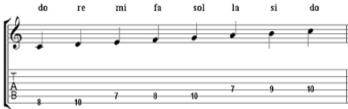
Görsel 2. Pentatonik ses dizisi.

1900'lü yılların başında ülkemizde halk müziği tarihi ile ilgili detaylı bir çalışma bulunmadığı bilinmektedir. Oysaki ülkemizde o yıllarda Türk sanat müziği üzerine detaylı çalışmalar yapılmıştır. İçinde tarih ve birçok dinamiği barındıran ve müzisyenlere çalışmalarında katkı sağlayacak olan halk müziği konusunda araştırma olmaması dönemin büyük eksikliklerinden biridir. 1900'lü yıllarda Avrupa'da “Türk halk müziği” Arap ve İran etkisinde kalmış bir müzik türü olarak bilinmektedir. Bu durum Ahmet Adnan Saygun ve M. Ragıp Gazimihal'i harekete geçirmiştir. Macarların M. Ragıp Gazimihal'e gönderdiği bir broşürdeki haritada Türkiye'yi Arap mıntıkası içinde göstermeleri üzerine bu yanlış düzeltilerek Türk halk müziğinde var olan pentatonik seslerden bahsedilmiştir. “Pentatonik: Yarım aralıklara yer vermeyen beş dereceli dizidir (Görsel 2).” Orta Asya'da Türk boyları tarafından kullanılmıştır. Anadolu türkülerinde Macar, Romen halk müziğinde izlerine rastlanmaktadır (Say, 1985: 361).