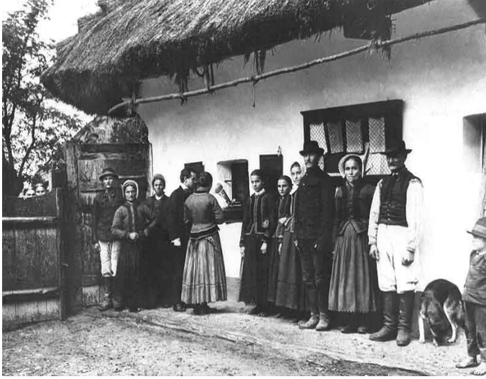
Görsel 1. Béla Bartók, 1908'de Slovak köylüler tarafından söylenen halk şarkılarını kaydetmek için bir Edison fonografi kullanıyor (URL- 3).

18. Yüzyıl Macarların halk müziğine ilgilerinin arttığı ve bunun aynadaki en önemli yansımalarından birinin Bela Bartok olarak karşımıza çıktığı bir dönemdir. Aşağıdaki görsel ise bu konuda bizlere kanıt olmaktadır. 1908 yılında çekilen fotoğrafta Béla Bartók, Slovak köylüler tarafından söylenen halk şarkılarını kaydetmek için bir Edison fonografi kullanıyor (Görsel 1).