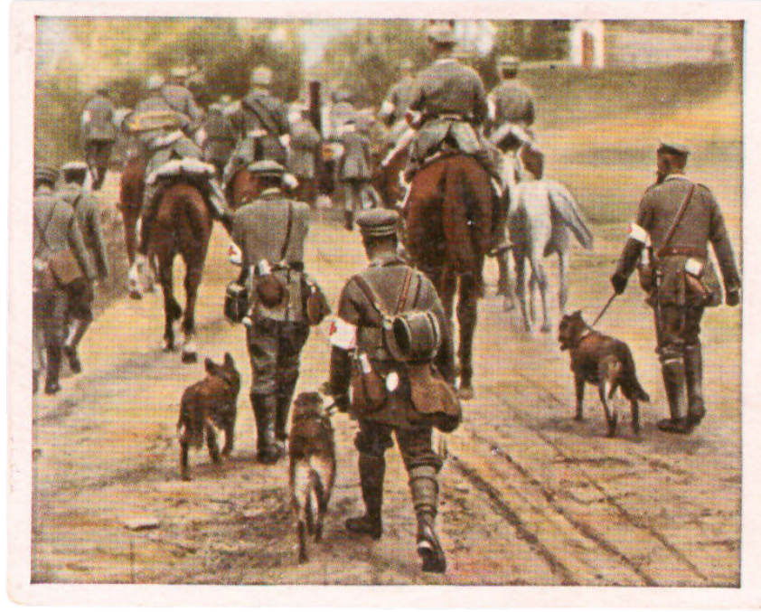
Resim 3: Sıhhiye Köpeklerinden Oluşan Hareket Halindeki Bir Askeri Birlik

Harp köpeklerine olan ilginin bir benzerinin İkinci Meşrutiyet döneminde polis teşkilatındaki ıslahata paralel olarak polis köpekleri için de gündeme geldiği görülmektedir. 75 Polis Mecmuası gibi dergilerde köpekler, polis memurlarının yanında asayişin sağlanmasına katkıda bulunan kuvvetler olarak okuyuculara sunulmaktaydılar. 1913 yılında yayımlanmaya başlayan Polis Mecmuası , köpeklerin polis kuvvetlerinin suç ve suçlularla mücadelesinde oynayabilecekleri yeni rolleri öven makaleler ve resimler için önemli bir mecra sağladı. 76 Köpeklerin derginin sayfalarında boy göstermesi bazı köpek ırklarının Avrupa'da, özellikle Fransa ve Almanya'da polis köpeği olarak seferber edilmeleri ile neredeyse aynı zamana denk geldi.