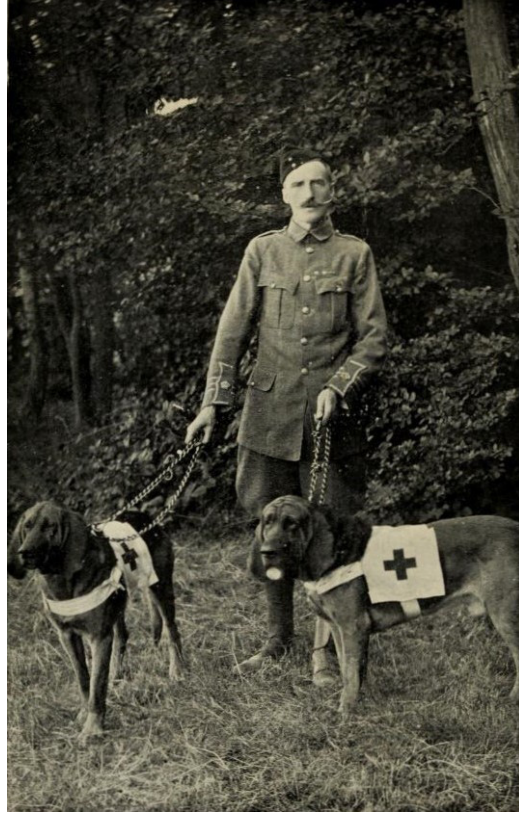
Resim 1: Binbaşı Edwin Hautenville Richardson ve sıhhiye köpekleri

Richardson İstanbul'a yanında iki Collie cinsi ve bir de Bloodhound (kan tazısı) olmak üzere üç köpekle hareket etmişti. Bunlardan Collie cinsi köpekler özellikle polis hizmetindeki yararlılıkları ve geceleri havlayarak tehlikeyi haber vermeleri ile nam salmışlardı. Bloodhound cinsi diğer köpek ise kaçan suçluların izini sürmekteki üstün yeteneği ile bilinmekteydi. Şark Ekspresi (Oriental Express) ile yaklaşık bir hafta süren bir yolculuğun ardından, köpekleri ve Binbaşı Richardson'ı İstanbul'da iki subay karşıladı. Richardson'a Yıldız Sarayı'nda köpek talimlerine, çoban köpeklerini idare etmekte deneyimli yirmi Arnavut – muhtemelen II. Abdülhamid'in koruma bölüklerinden – katılmıştı. Binbaşı İstanbul'da kaldığı süre zarfında her gün köpeklerle Saray'a giderek türlü eğitim verdi. Richardson II. Abdülhamid'i kendisini köpeklere adanmış birisi olarak tarif etmekte ve Avrupa'nın değişik şehirlerinden en iyi türleri toplandığını kaydetmektedir. O İstanbul'da köpekler için bir başka yerde inşa ettirilen ve başında bir Alman köpek eğitmenin bulunduğu köpek barınaklarından da söz etmektedir. Üç hafta süren bu seyahatin ardından II. Abdülhamid Richardson'a kalıp polis ve bekçi köpeklerini eğitmesi konusunda teklifte bulduysa da o bunu kabul etmeyerek İngiltere'ye döndü. 64