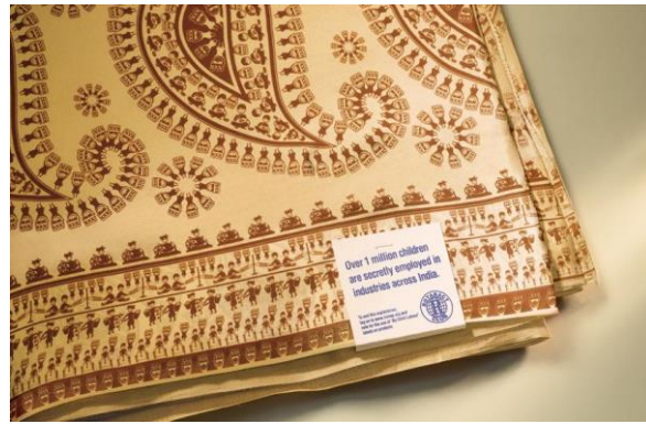
Resim 1. Bombay Rotary Kulübü'nün Kamu Spotu Reklamı

açısından incelendiğinde, posterde çocukları farklı iş kollarında çalışırken gösteren bir kilimin yer aldığı görülmektedir. Kilimin üzerinde yer alan desenlerde, çocukların bir kısmının toplayıcılık yaptığı, bir kısmının taşıyıcılık yaptığı, bir kısmının ise dikiş makinesinin önünde çalıştığı aktarılmaktadır. Kilimin üzerinde bir de etiket bulunmaktadır. Posterde kilimin kenarında yer alan etikette "1 milyondan fazla çocuk gizlice Hindistan'daki endüstrilerde istihdam edilmektedir. Bu istismarın sona ermesi için www.rcmsp.org'a kayıt olun ve ürünler üzerinde 'Çocuk İşçiliği Yok' etiketlerinin kullanımı için oy kullanın" yazıları yer almaktadır.