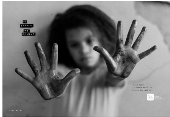
Resim 6. Kamu Bakanlığı Ulusal Konseyi'nin Kamu Spotu Reklamı

Kamu Bakanlığı Ulusal Konseyi (CNMP), Brezilya'da idari ve mali denetim yapan ve kurumların özerkliğine saygılı olarak vatandaşların lehine hareket eden bir yapıdır (CNMP, 2019). Kamu Bakanlığı Ulusal Konseyi'nin kamu spotu reklamı görüntüsel gösterge açısından incelendiğinde, posterde elleri çamur içerisinde olan küçük bir çocuk fotoğrafına yer verilmiştir. Posterde küçük çocuğun çamurlu ellerini postere bakanlara doğru uzattığı, kendisinin ise bulanık bir şekilde arka fonda kaldığı görülmektedir. Posterin solunda "Bunun sanat çalışması olması gerekir", sağında ise "Çocuk işçiliğinin asla olmaması gerekir" yazıları yer almaktadır.