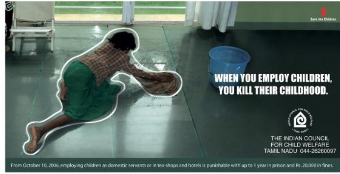
Resim 4. Çocukları Kurtarın Fonu'nun İkinci Kamu Spotu Reklamı

Çocukları Kurtarın Fonu'nun ikinci kamu spotu reklamı görüntüsel gösterge açısından incelendiğinde, posterde bir oda içerisinde yerleri temizlemekte olan bir çocuk fotoğrafına yer verildiği görülmektedir. Posterde çocuğun çevresinin beyaz bir çizgi ile çevrili olduğu aktarılmaktadır. Posterin sağ tarafında "Çocukları çalıştırdığınızda onların çocukluklarını öldürürsünüz" yazısı yer almaktadır.