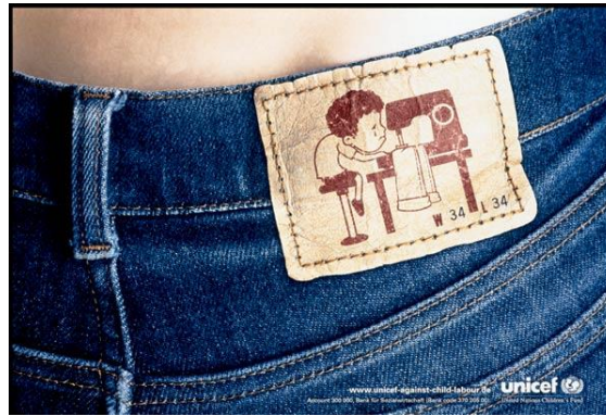
Resim 7. UNICEF'in Birinci Kamu Spotu Reklamı

1946 yılında kurulan Birleşmiş Milletler Uluslararası Çocuklara Acil Yardım Fonu (UNICEF), çocukların temel gereksinimlerini sağlamaya çalışan, çocuk haklarının korunması adına tanıtım ve savunma çalışmaları yapan uluslararası bir kuruluştur (UNICEF, 2019). UNICEF'in birinci kamu spotu reklamı görüntüsel gösterge açısından incelendiğinde, posterde bir kot pantolon görseline yer verildiği görülmektedir. Kot pantolonun üzerindeki markası yazması gereken etiketin üzerinde ise dikiş makinesinde çalışan bir çocuk görseline yer verilmiştir.