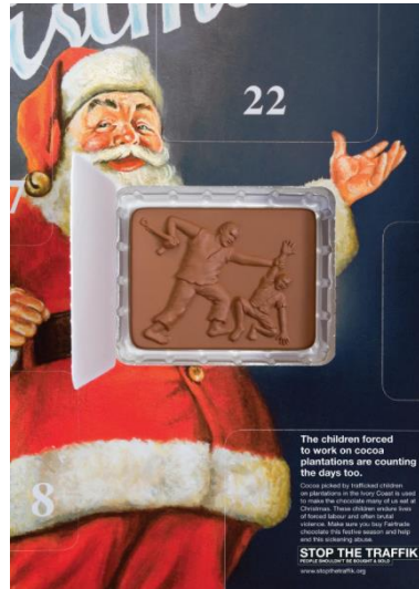
Resim 5. İnsan Ticaretini Durdur Örgütü'nün Kamu Spotu Reklamı

İnsan Ticaretini Durdur Örgütü, insan ticaretinin önlenmesi için çalışan, toplumu bilgilendirerek ve harekete geçirecek dünya genelinde insanları, insan kaçakçılığına karşı birleştirmek için çalışan bir yapıdır (ST, 2019). İnsan Ticaretini Durdur Örgütü'nün kamu spotu reklamı görüntüsel gösterge açısından incelendiğinde, posterin arka fonunda bir Noel Baba görselinin olduğu görülmektedir. Noel Baba'nın önünde ve posterin merkezinde ise üzerinde bir adamın, bir çocuğu darp ettiğini gösteren bir çikolatanın olduğu aktarılmaktadır. Posterin sağ alt bölümünde "Kakao tarlalarında çalışmaya zorlanan çocuklar da gün sayıyor. İnsan ticareti yapan çocuklar tarafından Fildişi Sahili'ndeki tarlalarda toplanan kakao, çoğumuzun Noel'de yediği çikolatayı yapmak için kullanılır. Bu çocuklar zorla çalıştırma ve çoğu zaman şiddet içeren şiddete maruz kalır. Bu festival sezonunda Fairtrade çikolatasını aldığınızdan ve bu rahatsız edici suiistimali sona erdirdiğinizden emin olun" yazısı yer almaktadır.