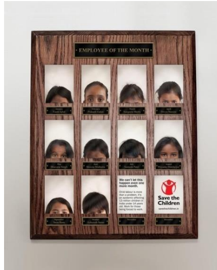
Resim 3. Çocukları Kurtarın Fonu'nun Birinci Kamu Spotu Reklamı

Çocukları Kurtarın Fonu, 1919'da çocukların yaşamlarını iyileştirmek, çocuklara daha iyi eğitim, sağlık ve ekonomik fırsatlar sağlamak amacıyla kurulan bir örgüttür (SC, 2019). Çocukları Kurtarın Fonu'nun birinci kamu spotu reklamı görüntüsel gösterge açısından incelendiğinde, posterde duvara asılı bir çerçevenin olduğu görölmektedir. Çerçeve de ise başlarının sınırlı bir kısmı görölen çocuk fotoğrafları olduğu aktarılmaktadır. Çocukların fotoğrafının olduğu çerçevenin üzerinde "Ayın Çalışanı" yazı bulunmaktadır. Çerçevenin alttaki boşluklarından birinde ise "Bunun bir ay daha olmasına izin veremeyiz. Çocuk işçiliği bir problemden daha fazlasıdır. Hindistan'da 14 yaşın altındaki 13 milyon çocuğu etkileyen bir salgın. Çalışmaya zorlananlar için çalışın" yazısı yer almaktadır.