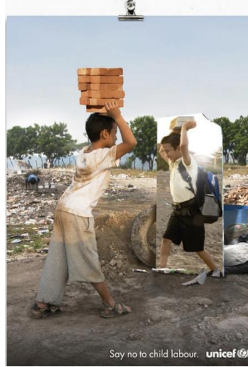
Tablo 8. UNICEF'in İkinci Kamu Spotu Reklamı

Belirtisel gösterge olarak posterde çocuk işçiliği ile çocukların eğitim sürecinin ilişkilendirildiği görülmektedir. Posterde çocukların çalıştırılmaları sonucunda eğitimlerine devam edemedikleri aktarılmaktadır. Posterde küçük çocuğun taşıdığı kiremitler çocuk işçiliğini, kitaplar ise eğitimi simgelemektedir. Çocuğun kiremit taşıırken aynanın karşısında kendisini okul üniforması içerisinde kitap taşıırken hayal etmesi ile çocukların çalışmak yerine okumak istedikleri algısını oluşturmaktadır. Kamu