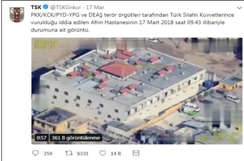
Resim 6. Afrin Hastanesi'nin 17 Mart 2018 Tarihindeki Sağlam Durumu (@TSKGnkur, 17.03.2018, Erişim Tarihi: 06.06.2018)