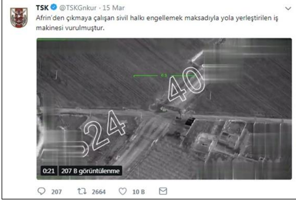
Resim 4. Sivil Halka Geçit Vermeyen Terörist Engellerinin Ortadan Kaldırılması (@TSKGnkur, 15.03.2018, Erişim Tarihi: 06.06.2018).

Resim 4’de Afrin’den kaçmak isteyen sivil halkın kaçışlarını engellemek isteyen terör örgütlerinin çıkış yoluna yerleştirdikleri ağır iş makinesinin TSK tarafından vurulma anı yer almaktadır. TSK’nın bu noktadaki temel amacı terör örgütlerinden kaçan sivil halkın kaçış yolunu açmak ve güvenli bölgelere ulaşmasını sağlamaktır. Çünkü Afrin’den çıkmaya çalışan sivil halkın önlerine konulan engelleri kendi çabaları ile aşmaları oldukça zordur. Resim 5’de sivil halkın ilgili zorlukları kazma ve kürek gibi ilkel aletlerle aşmaya çalıştıkları gösterilmiştir. Bu sebepten dolayı TSK terör ile mücadele ederken, aynı zamanda sivil halkın terörden zarar görmemesi, güvenli bölgelere ulaşması ve önlerine yerleştirilen engellerin kaldırılması için de çaba sarf etmektedir.