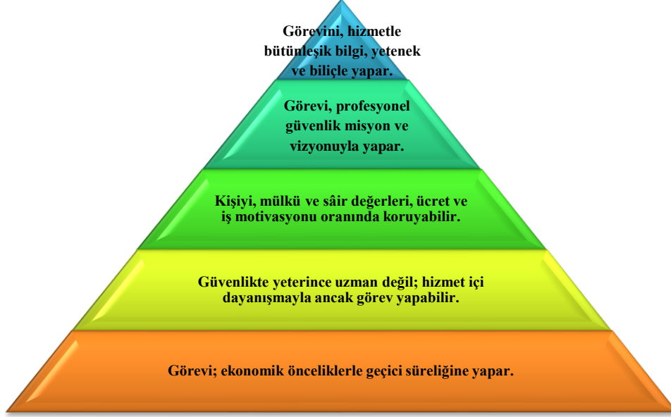
Şekil 2. Özel/Güvenlik Hizmetine Dönük Personel Nitelik Piramidi

Özel güvenlik personel hizmet niteliğine dönük bu piramitten de anlaşılacağı gibi, güvenlik işini yapan her güvenlik personelinin yaptığı göreve/işe olan yaklaşımı ve katkısı aynı değildir. Nitekim özel güvenlik hizmetine yönelik yapılmış çalışmalar ile gündem olan haberler, ağırlıklı olarak mevcut özel güvenlik hizmetinin piramidin ilk üç basamağında konumlanışını resmetmektedir. Ancak, sınırlı oranda şirket, kurum ve özel güvenlik görevlisi dördüncü, hatta beşinci basamakta konumlandırılmayı hak edebilmektedir. Bu piramide göre nitelikli istihdam için öncelenmesi gereken eşik ise üçüncü kategoriden başlatılabilir. Sektörün bu manzarasının, sektörün iç güvenlik hiyerarşisindeki konumuyla olan alakası ise tartışmasızdır.