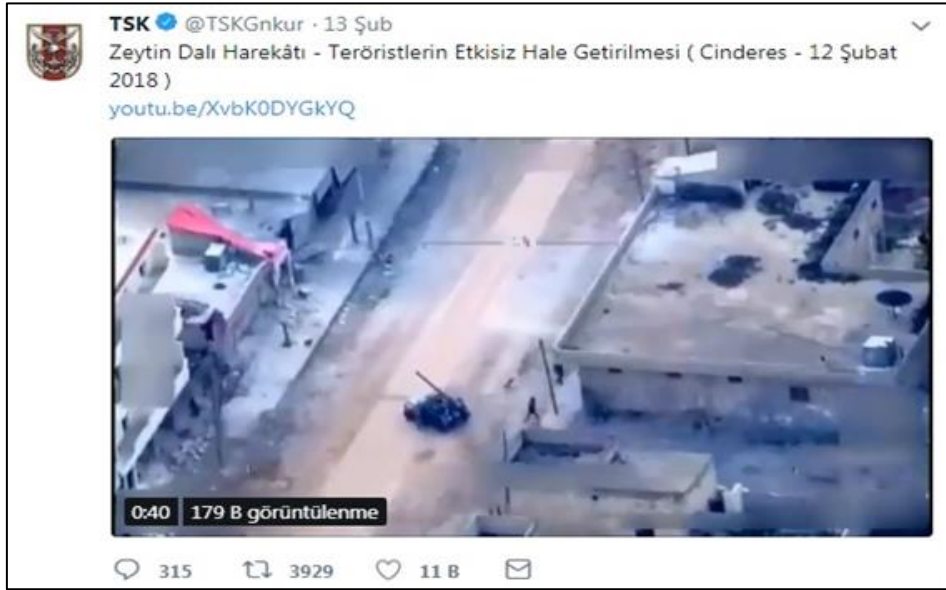
Resim 1. Cinderes'te Teröristlerin Etkisiz Hale Getirilmesi (@TSKGnkur, 13.02.2018, Erişim Tarihi: 06.06.2018).

Bu bölümde TSK'nın Afrin Operasyonu süresince sosyal medya (Twitter) hesabı (@TSKGnkur) üzerinden yaptığı İHA görüntülerini içeren paylaşımlar incelenmiştir. Bu amaçla TSK'nın sosyal medya (Twitter) hesabı incelenmiş ve paylaşımların TSK'ya karşı başlatılan karalama çabalarına karşı birer cevap olabilecek nitelikte olanları analizi edilmeye çalışılmıştır. Böyle bir uğraş içerisinde girilmesindeki temel amaç, Afrin Operasyonu'nun, özellikle terör örgütleri ve terör örgütlerini destekleyen çevrelerce, temel hedeflerinden saptırılarak, operasyonu bir işgal ve zulüm saldırısı gibi gösterilmeye çalışılmasına karşı TSK'nın sorun yönetimi bağlamında başarılı bir şekilde halka ilişkiler faaliyetlerini yürüttüğü öngörüsüdür. Bu amaçla, aşağıda, TSK'nın sosyal medya (Twitter) üzerinden gerçekleştirdiği paylaşımlara yer verilmiştir (@TSKGnkur, Erişim Tarihi: 06.06.2018).