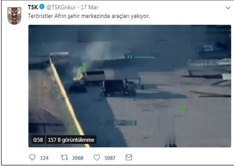
Resim 8. Afrin Şehir Merkezinde Teröristlerin Faaliyetleri.

Resim 8’de Afrin şehir merkezinde teröristler tarafından olası amaçlar dâhilinde sayılabilecek olan mala zarar vermek, şehir merkezini enkaza çevirmek, yıkıntılar ile şehrin genel görüntüsünü bozarak korku ortamı yaratmak, sivil halkın kullanabileceği olanakları ortadan kaldırmak için araçları yakmasının görseline yer verilmiştir. Bu görsel ile birlikte bir kez daha teröristlerin sivil halkı ve sivil unsurları hedef aldığı ispatlanmış durumdadır. Sonuç olarak İHA görüntüleri ile de ispatlandığı üzere Afrin kentinde yaşayan sivil halk terör örgütleri tarafından hedef alınmıştır. Yapılmaya çalışılan karalayıcı propagandanın gerçekleri (sivillerin öldürülmesi, sivillerin kaçış yollarının kapatılması, sivil unsurlara zarar verilmesi) TSK tarafından değil, terör unsurları tarafından yapılmış olduğu görülmektedir.