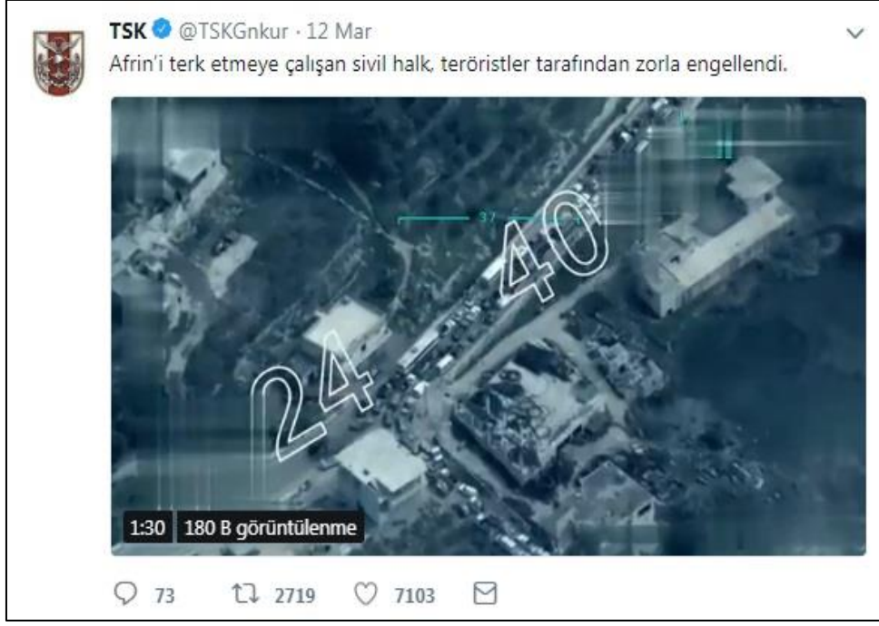
Resim 3. Teröristlerin Sivil Halka Uyguladığı Engeller (@TSKGnkur, 12.03.2018, Erişim Tarihi: 06.06.2018).

Resim 3’de Afrin’i araçlarıyla konvoy halinde terk etmeye çalışan sivil halkın teröristler tarafından yollarının kesilerek engellenmesinin görseli yer almaktadır. Bu görsel üzerinden sivil halkın terör gruplarının baskılarına ve engellerine maruz kaldıkları görülmektedir. Dolayısıyla yapılan karalayıcı propagandanın vermek istediği mesajın aksine sivil halka TSK’nın değil, bölgede konumlanan ve TSK’nın temizlemeye çalıştığı terör unsurlarının zarar verdiği gözler önüne serilmektedir.