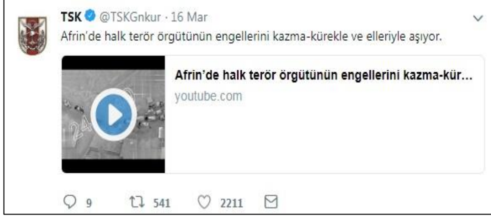
Resim 5. Sivillerin Teröristlerden Kaçma Çabaları (@TSKGnkur, 16.03.2018, Erişim Tarihi: 06.06.2018).