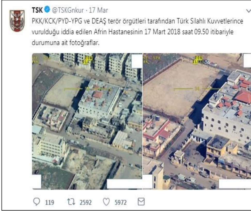
Resim 7. Afrin Hastanesi'nin Fotoğrafları.

Resim 6 ve 7'de PKK/KCK/PYD-YPG ve DEAŞ terör örgütlerinin TSK'nın askerî operasyonuna engel olmak, kendilerine hareket alanı kazanmak, yerel ve uluslararası alanda destekçi bulmak için operasyonların sivil halka ve hastane gibi hayati önemi bulunan noktalara yönelik olduğunu iddia eden karalayıcı propaganlarına cevap olarak 17 Mart 2018 tarihinden önce vurulduğu öne sürülen hastanenin İHA'lardan alınan fotoğraf ve video görüntüleri ile 17 Mart 2018 tarihindeki sağlam yapısı gözler önüne serilmiş ve ilgili görüntüler ile TSK'nın hastaneye yönelik bir operasyonunun olmadığı ispatlanmıştır.