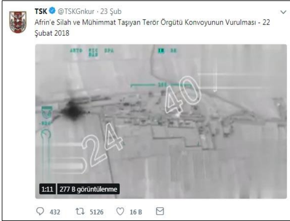
Resim 2. Teröristlere Silah ve Mühimmat Taşıyan Konvoyun Vurulması (@TSKGnkur, 23.02.2018, Erişim Tarihi: 06.06.2018).

Resim 1’de TSK’nın hedef olarak belirlediği teröristlerin vurulma ve öncesinde de takip anları yer almaktadır. Bu görsel ile birlikte TSK’nın temel hedefinde yalnızca Afrin bölgesinde terör eylemleri içerisine giren unsurların yer aldığı ve bu unsurların vurulma anında çevrede sivillerin bulunmadığı ispatlanmaktadır.